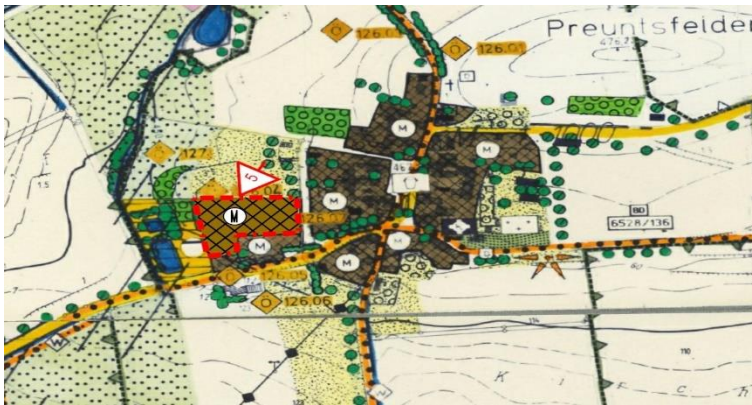
Ausschnitt: 5. Flächennutzungsplanänderung Gemeinde Windelsbach