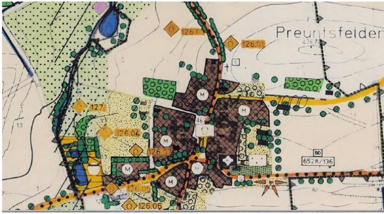
Ausschnitt Flächennutzungsplan Gemeinde Windelsbach (Stand: 02/2000)