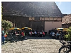
Café Kostbar Colberg

Auf der letzten Etappe mit ca. 50 verbliebenen Radlern ging es zurück nach Colberg ins Café „Kostbar“, zum gemütlichen Ausklang mit Kaffee und leckeren Torten.